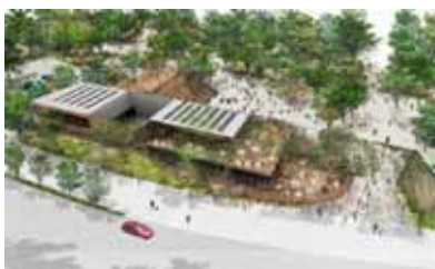
名城公園 tonarino (トナリノ) 完成予想図